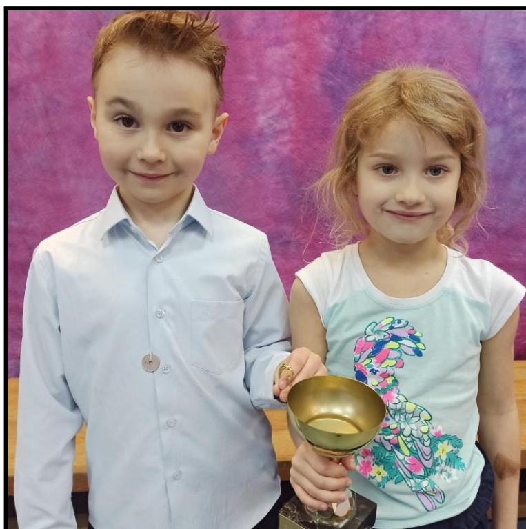
Класс - Победитель - Y1DS with 99%